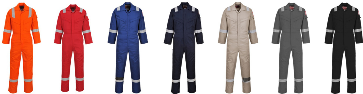
Cores e tamanhos disponíveis: