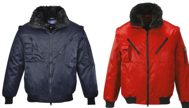
Cores e tamanhos disponíveis: