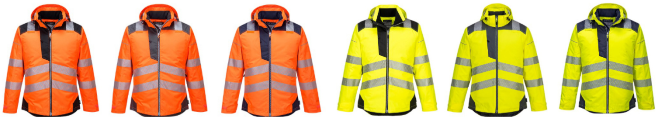
Cores e tamanhos disponíveis: